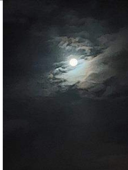
09/11, 07:00 uur, maan, Delft, Lia Claus

Wat te doen met bladafval en eikelschade op een auto ? Zie de tips in deze nieuwsbrief