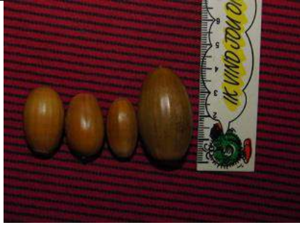
09/11, eikels , Delft, Aukje Gjaltema

De eikels zijn dit jaar erg groot. Sommige waren wel 4 cm lang, en daarmee tot 8 keer zo zwaar als normaal.