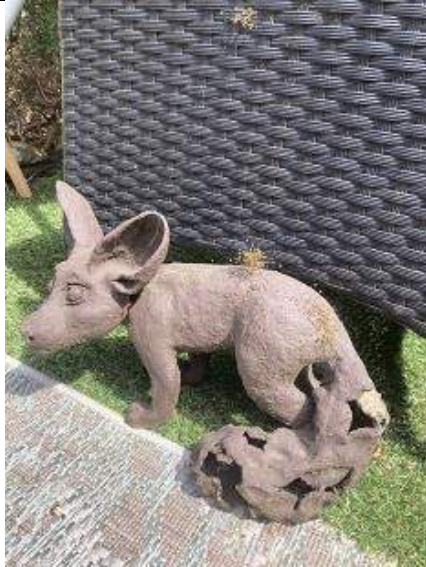
07/11, spinnen , Laurien Bouw

Afgelopen zomer zag ik het bewijs dat dieren en kunst heel goed samen kunnen gaan. Je ziet hier baby spinnetjes op een beeldje van een woestijnvos. Moeder spin had de eitjes heel slim, lekker droog en warm, in de holle staart gelegd. Na het uitkomen waren ze binnen een dag of drie allemaal vertrokken. Overdag krioelden ze verspreid over het web en 's avonds kropen ze weer bij elkaar. Je ziet op de foto drie samenscholingen... en het nest zie je uiterst rechts op de staart van de vos. Het zat oorspronkelijk helemaal verstopt in de staart.