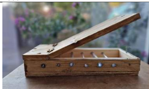
Bijen Bee & Bee

Bestel de Bijen Bee & Bee bij Natuurlijk Delfland Sinterklaas en kerst komen er aan. Tijd voor natuurcadeautjes. Bij Natuurlijk Delfland kan je een Bijen Bee & Bee bestellen. Zie foto. De BB&B is bedoeld te laten zien hoe bijen hun eitjes leggen. Het bijenhotelletje heeft 6 slangetjes met verschillende diameter voor verschillende soorten bijen. Het dak kan openscharen om in het hotel te kijken. De Bijen Bee & Bee kan je bestellen bij medewerkernatuurlijkdelfland@knnv.nl en de prijs is tien euro.