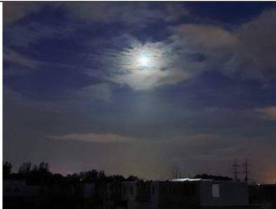
09/11, 07:00, maan, Delft, Lia Claus