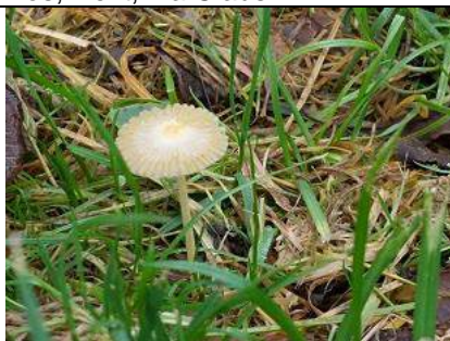
08/11, onbekende paddenstoel , Melarium-Akkesdijkse Bos, Delft, Lia Claus