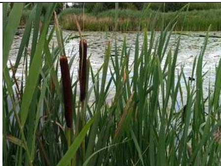
27/07, grote lisdodde , Tanthofkade, Delft, Lia Claus