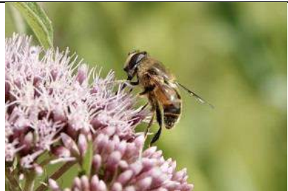
27/07, blinde bij , Broekpolder, Vlaardingen, Margreet Sleeuwenhoek