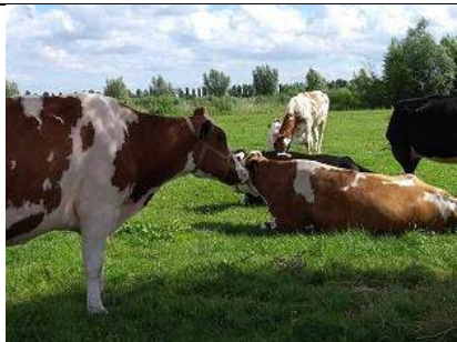
25/07, koeien , Tanthofkade, Delft, Lia Claus