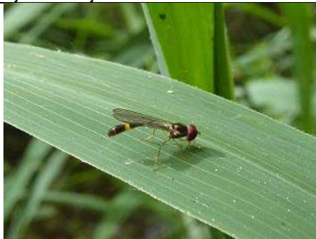
15/07, vliegende speld , Groene Wal Gouda, Tjerk Nawijn