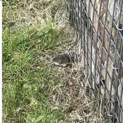
27/07, muis , Delfgauw, Bart Hendriks