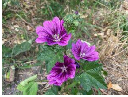
25/07, tuinkasjeskruid , buurttuin, Delfgauw, Bart Hendriks