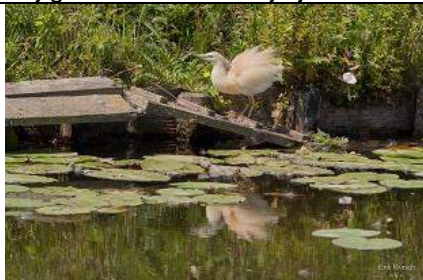
18/07, ralreiger , Berkel, Erik Rausch

Wij gaan er vanuit dat je je waarneming zelf meldt via www.waarneming.nl