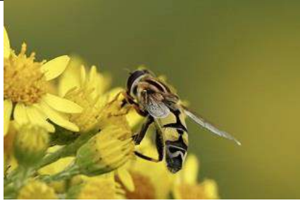
27/07, citroenpendelvlieg , Broekpolder, Vlaardingen, Margreet Sleeuwenhoek