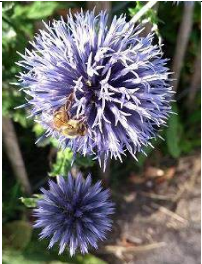
26/07, kogeldistel en honingbij , Tantofkade, Delft, Lia Claus