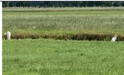
26/07, witte reigers , Abtswoudse Bos, Delft, Marjon van Holst