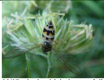
06/07, slanke driehoeksweefvlieg , Groene Wal, Gouda, Tjerk Nawijn