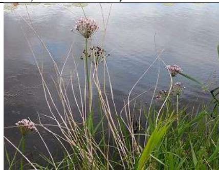
27/07, zwanenbloem , Tanthofkade, Delft, Lia Claus