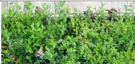
28/07, huismus (~10x), Tanthof, Delft, Aukje Gjaltema