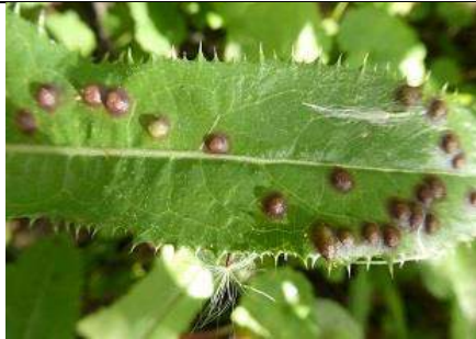
27/07, melkdistelpokgalmuggal op akkermelkdistel , Den Hoorn, Willemein