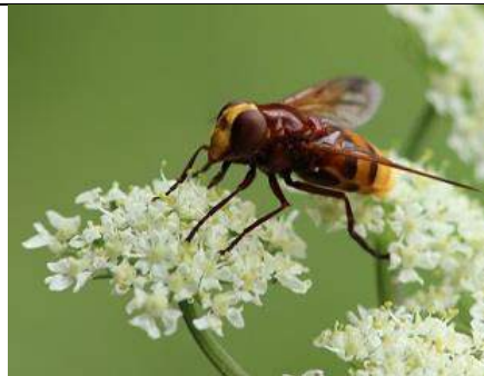
20/07, stadsreus , Westerpark, Zoetermeer, Christine Slinger