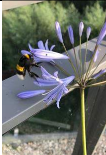
27/7, aardhommel , Janine Pol