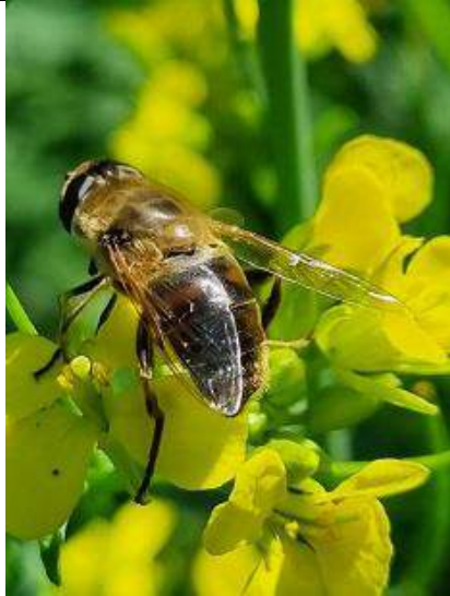
24/07, blinde bij , Tramkade 24b Schipluiden, Huub van 't Hart