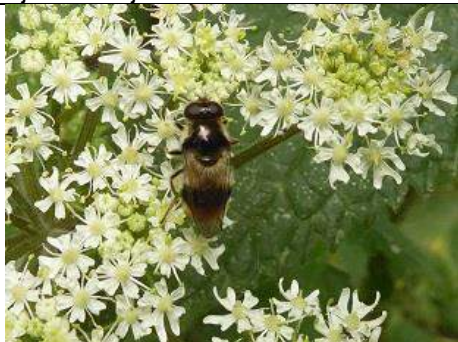
22/07, wollig gitje , Groene Wal Gouda, Tjerk Nawijn