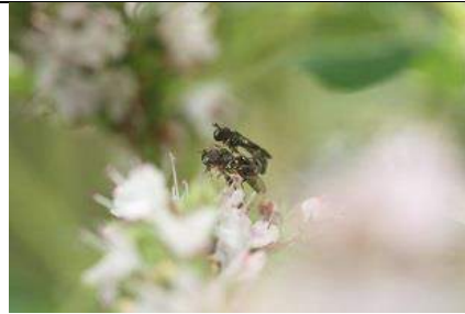
14/07, menuetzwweiflieg , in copula op marjolein , Huub van 't Hart