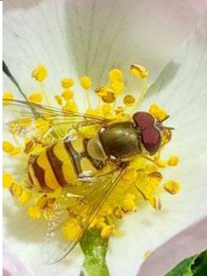
09/07, zweefvlieg , Joke Kronshorst