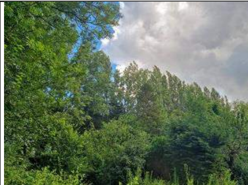
Bos met vleermuizen