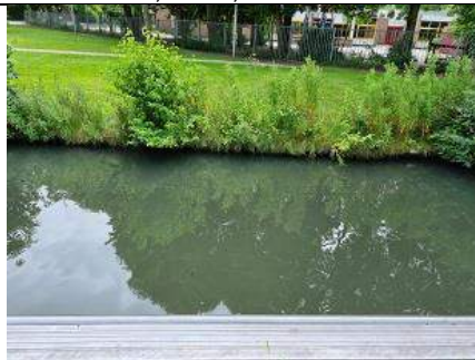
10/07, sloot met zwart water, Lepelaarpad/Hagedissingel , Tanthof Oost, Delft, géén enkel waterplant, Huub van 't Hart