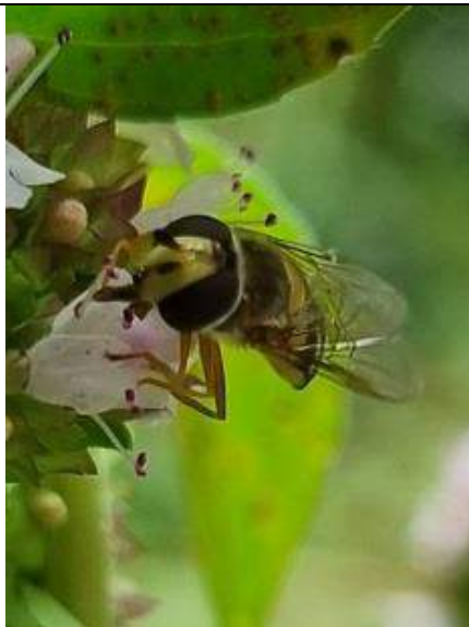
15/07, terrasjeskommazweefvlieg op marjolein , Kwarteltuin, Delft, Huub van 't Hart