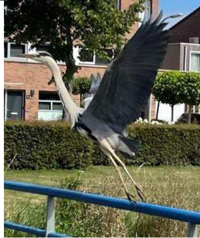
15/07, blauwe reiger , Delfgauw, Bart Hendriks