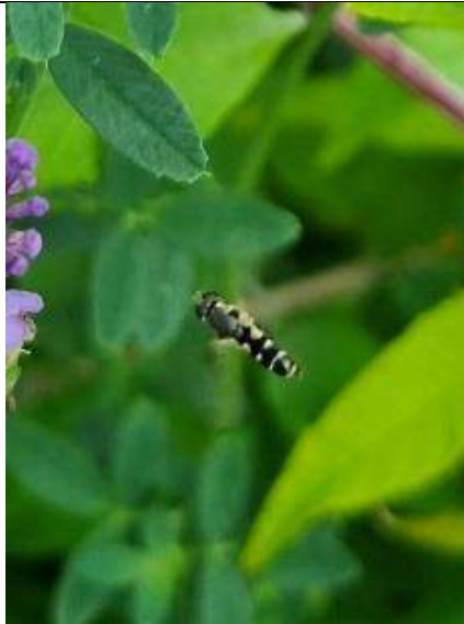
11/07, menuetzwweiflieg (2 ex) zwevend, openbare Kwarteltuin Tanthof, Delft, Huub van 't Hart.