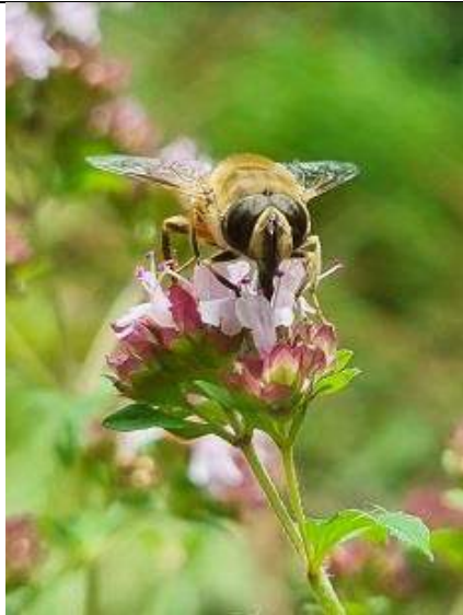
07/07 blinde bij op marjolein , Kwarteltuin, Delft, Huub van 't Hart