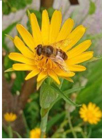
09/07, zweefvlieg , Rijswijk Vrijenban, Pieter van der Bruggen