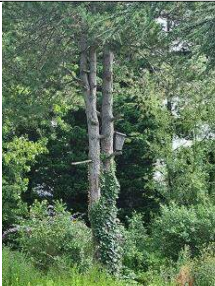
Kast met ransuil

Rondom de locatie van ATV De Schoffel in Pasgeld/Rijswijk Buiten is veel aan de hand. De gemeente wil hier in Pasgeld West 1000 huizen bouwen. Ecologisch onderzoeksbureau Van der Helm heeft echter in een onderzoek aangetoond dat er rondom de volkstuinten van amateurvereniging De Schoffel zich veel natuurwaarden bevinden. De gemeente wil voor de huizenbouw de goed ontwikkelde bomensingel met honderden bomen tussen de Schoffel en de Lange Kleiweg kappen. Groot probleem is echter de aanwezigheid van een kolonie ransuilen, waarvan een broedpaar in een jaarrond beschermd nest. Zie foto Huub van 't Hart. Ransuilen zijn vanwege de Vogelrichtlijn strikt beschermd, omdat hun staat van instandhouding als 'zeer ongunstig' wordt gekwalificeerd. De Raad van State heeft tevens hun foerageergebied van 1 kilometer omtrek rond het nest als te beschermen locatie aangewezen. Hierdoor kunnen de voorgenomen 110 woningen in Pasgeld Oost en circa 500 woningen in Pasgeld West niet gebouwd worden. Ook hangt in deze singel een bosuilenkast. Zie foto Huub van 't Hart. Tijdens het natuurwaardenonderzoek bleek de kast niet bewoond, maar volgens vogelaars huizen er wel degelijk bosuilen onder andere op het TNO-terrein. Vanwege zijn nachtelijke leefwijze wordt de bosuil niet altijd gespot. Een ander probleem vormt de door VanderHelm geconstateerde aanwezigheid van gewone en ruige dwergvleermuizen en de watervleermuis. Alle vleermuizen zijn eveneens strikt beschermd.