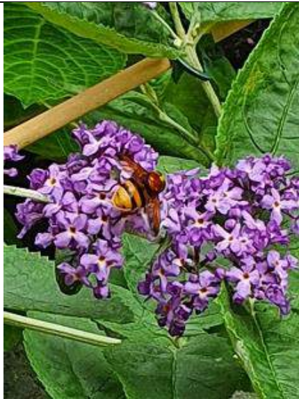
09/07, zweefvlieg , Jol Lek