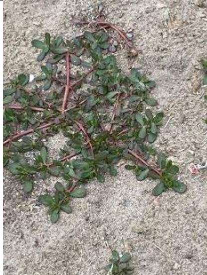
06/07, postelein , Schipluiden, Ria Suijker