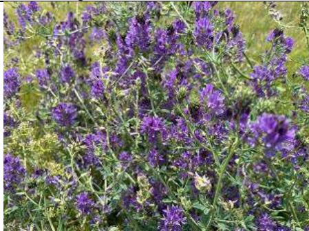
11/07, luzerne , Pijnacker, Bart Hendriks