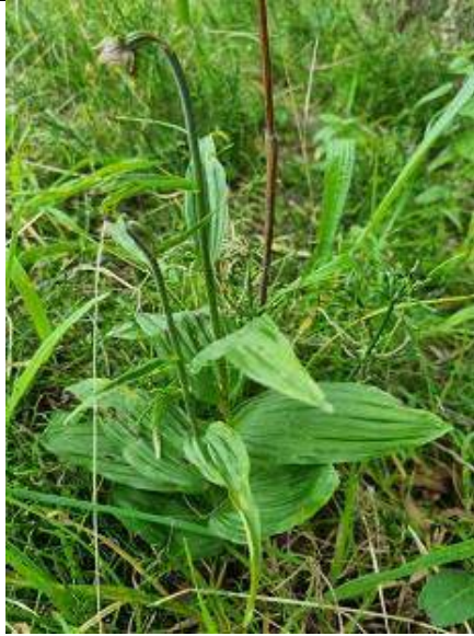
12/07, brede wespenorchis (2 ex), Kruithuis, Delft, Huub van 't Hart