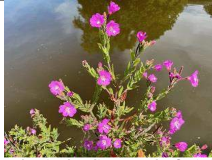
11/07, harig wilgenroosje , Oude Leede, Bart Hendriks