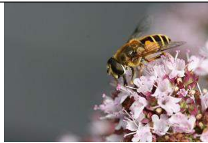
15/7, bosbijvlieg op marjolein , Kwarteltuin, Huub van 't Hart.

17/05/1739, Europese otter , Abtswoudse bos-oost, Delft klik hier