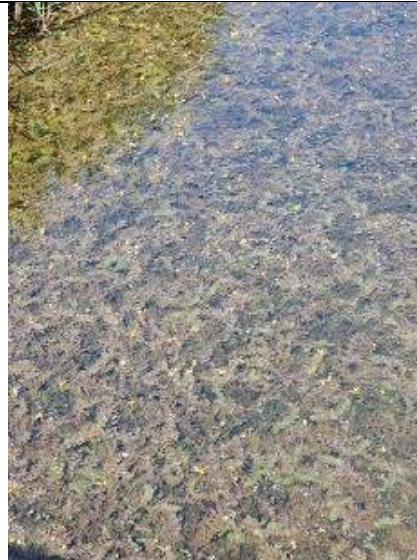
14/07 groot blaasjeskruid (>1000 ex), kreek Abtswoudsebos Midden. Zie foto Huub van 't Hart