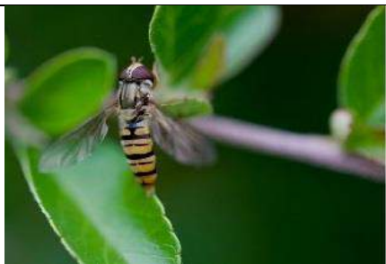
10/07, snorzweefvlieg , Steenvoorde-zuid, Rijswijk, Jos Bolte