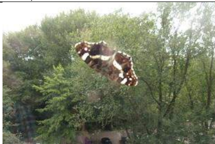
09/07, landkaartje , Freek Boon