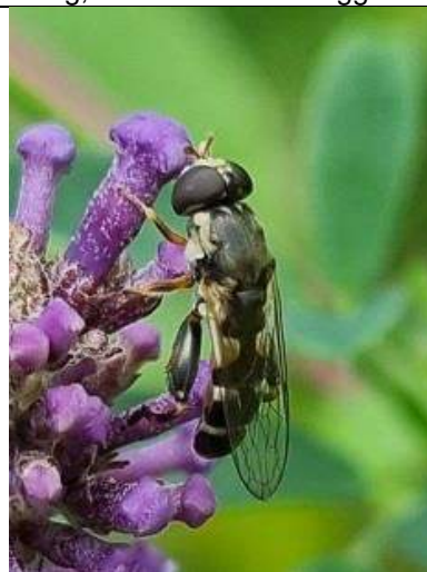
11/07, menuetzweefvlieg (2 ex) op buddleia, openbare Kwarteltuin Tanthof, Delft, Huub van 't Hart.