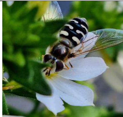
05/07, witte halvemaan-zweefvlieg , Buitenhof, Delft, Joke Kronshorst