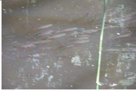
02/07, voorn tjes, Abtswoude naast Waterspeeltuin, Tanthof-Oost, Delft, Freek Boon