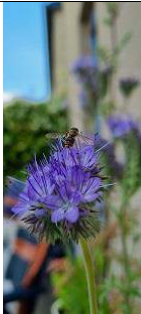
14/06, snorzweefvlieg op phacelia , Molensingel, Schiedam, Joris P.