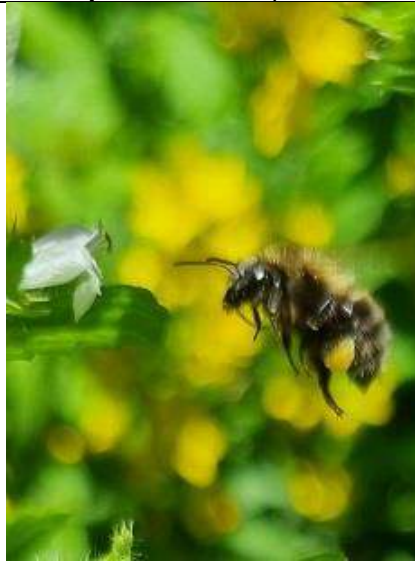
08/07, boomhommel op citroenmelisse , Kwarteltuin, Delft, Huub van 't Hart