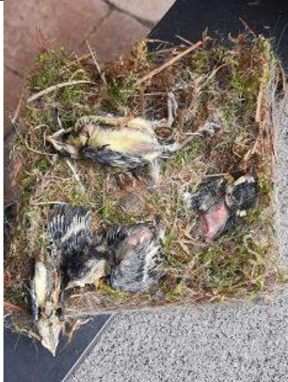
10/07, dode jonge mezen , Wateringseveld, Den Haag, Hans Jansen