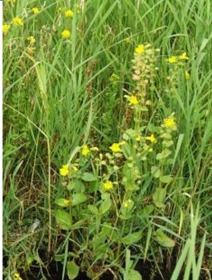
23/06, gele maskerbloemen , Schipluiden, Aukje Gjaltema