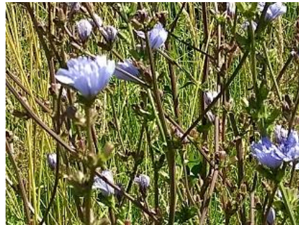
28/06, wilde cichorei , fietspad Buitenhof, Delft, Lia Clau