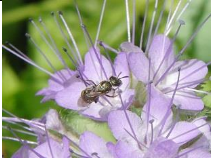
24/06, smaragdgroefbij , Syriësingel, Delft, Aukje Gjaltema