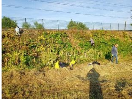
29/06, langs de metrolijn

Een andere brigadist heeft diezelfde avond op het natuurterreintje vlak achter IKEA alle RBK's verwijderd en ook hier het zaad afgevoerd. Ook het terrein rond het stadion van DHC is deze week bevrijd van de RBK's, waarvan een aantal zeer moeilijk te bereiken was te midden van velden met braamstruiken. Met de nodige schrammen maar met een voldaan gevoel toog ook deze brigadist om 21.00 uur naar huis.