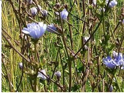
28/06, wilde cichorei , fietspad Buitenhof, Delft, Lia Claus