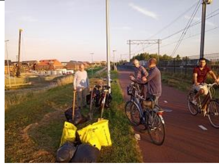
29/06, 6 zakken zaad