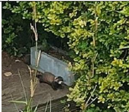
27/06, bunzing (2ex.), Hardenbroeklaan, Rijswijk Pasgeld, Elly Koole