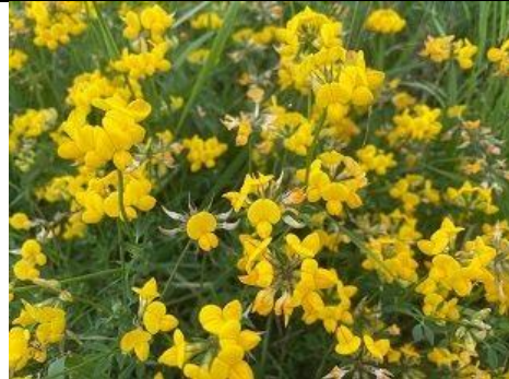
25/06, rolklaver , Pijnacker, Bart Hendriks