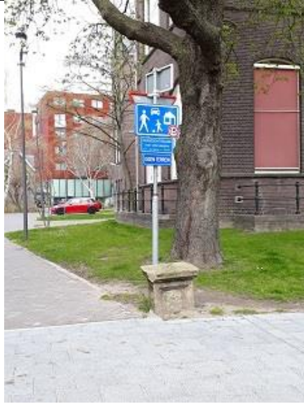
01/07, oude zandstenen paal , Raymond van der Ham