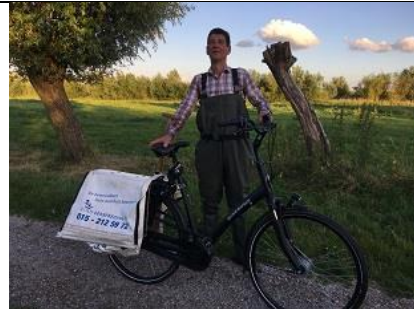
2 juli, RBB Abtswoudse Bos midden

Deze zaterdagmiddag is (het grootste deel van) de groep Abtswoude Bos midden even voor een zomerse koek-en-zopie bij elkaar gekomen om het seizoen af te sluiten. Er blijft nog gemonitord en