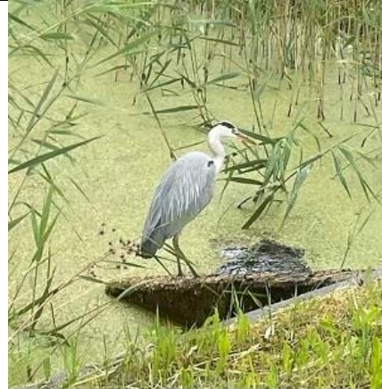
01/07, blauwe reiger , Delfgauw, Bart Hendriks