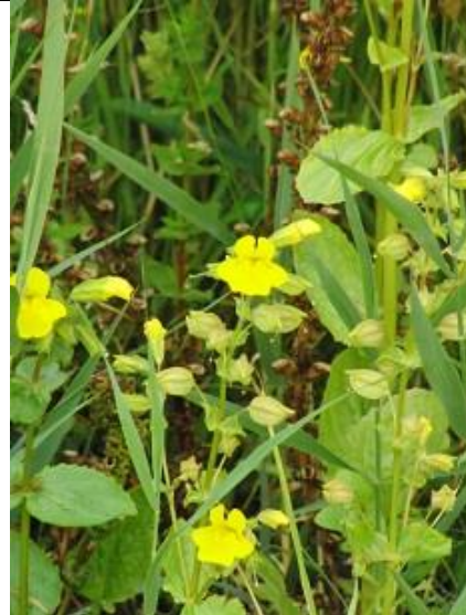
23/06, gele maskerbloemen , Schipluiden, Aukje Gjaltema