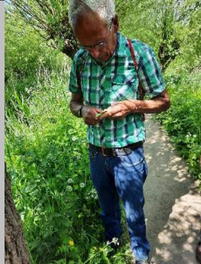
Snijden van een fluitje uit de stengel van fluitenkruid.