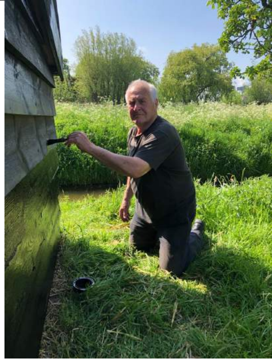
De stal op boomgaard Veelust is geschilderd