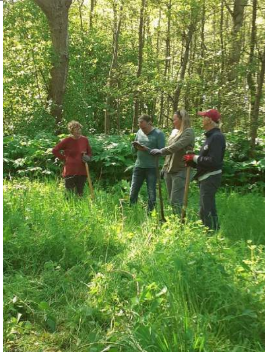
RBB Abtswoudse Bos Midden