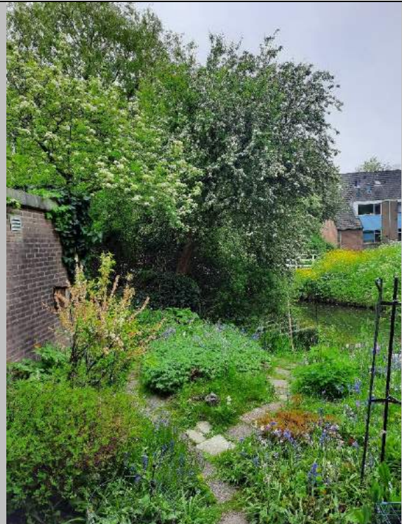
De Wezeltuin op 5 mei.