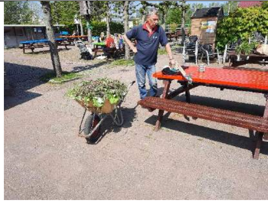
Een kruiwagen met bijkruid