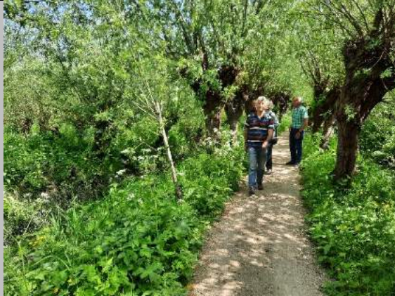
Een groene oase