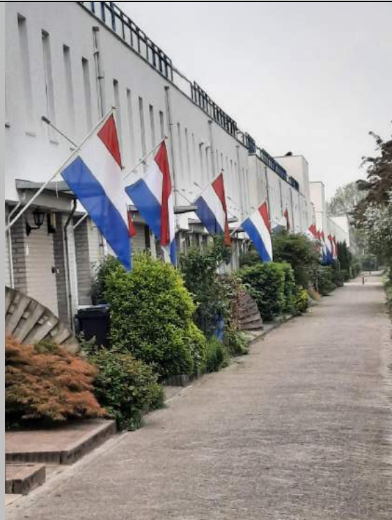
De Pelikaansingel in Delft. De straat met de meeste vlaggen op 5 mei?