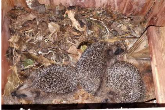
09/10, egels , Westerhonk, Els van Vliet.

28/09, viervlekkig aziatisch lieveheersbeestje , kinderboerderij Tanthof.