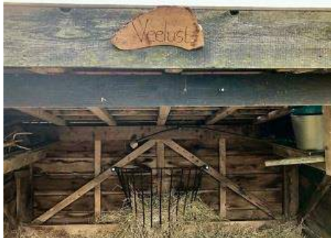
05/10, Veelust.met bord van de omgezaagde perenboom