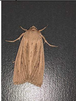
05/10, herfstrietboorder , Den Hoorn, Willemein.