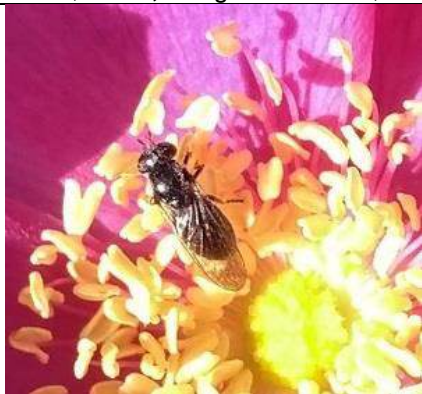
08/10, micaplatvoetje op rimpelroos , Kijkduin, Lia Claus.