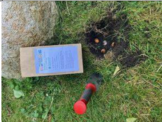
06/10, bollen in de tuin Wouter Müller.