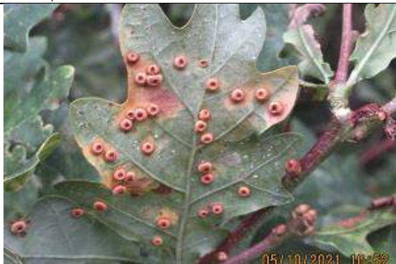
05/10, knoopjesgal , Melarium, Jos van Koppen.