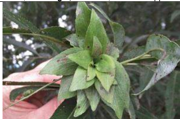
05/10, stervormige bladgal op wilg, Melarium, Jos van Koppem.