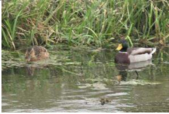
05/10, 37-16-33, wilde eend mannetje en vrouwtje Delftsestraatweg. Jos van Koppen.