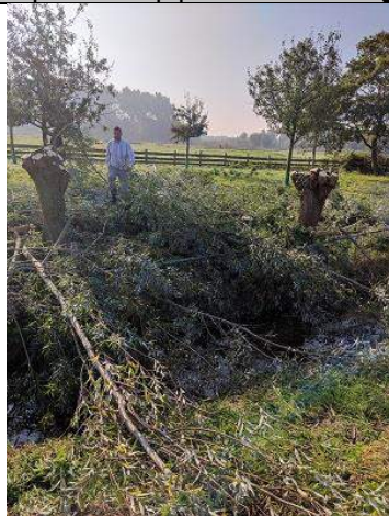
09/10, knotten boomgaard Ackersdijk, Frank Herfs.

Er is geoefend met een nieuw apparaat om vleermuizen te lokaliseren. Uiteraard werkt deze op de geluiden van vleermuizen en de naam van de vleermuis komt tevoorschijn. In het Hofpark van Wateringen zijn de volgende soorten gevonden: gewone dwergvleermuis - Pipistrellus pipistrellus en ruige dwergvleermuis - Pipistrellus nathusii.