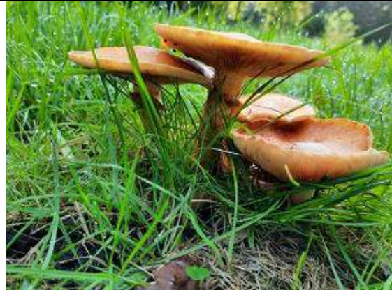
08/10, prachtvlamhoed , Overvoorde, Annemieke van Oosten.