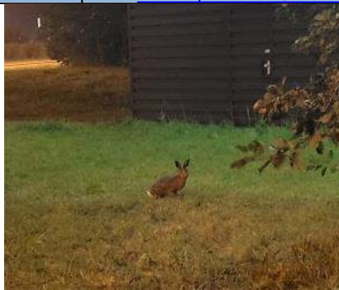
07 10, haas , gezien om 23.15 uur bij de Lagosweg 63 te Delft., Miranda Lelieveld.