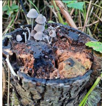
08/10, zwerminktzwam , Overvoorde, Annemieke van Oosten.