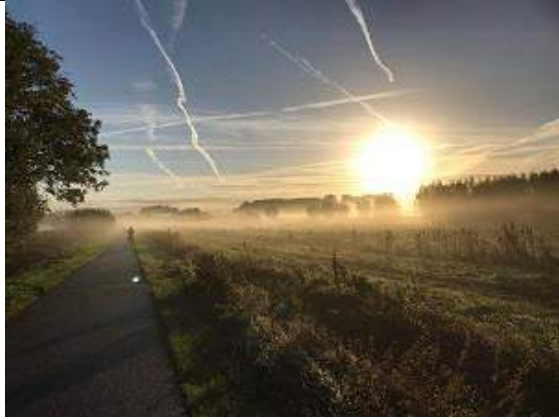
07/10, zonsopgang Sint Maartensrechtpad, Piet van Spronsen.