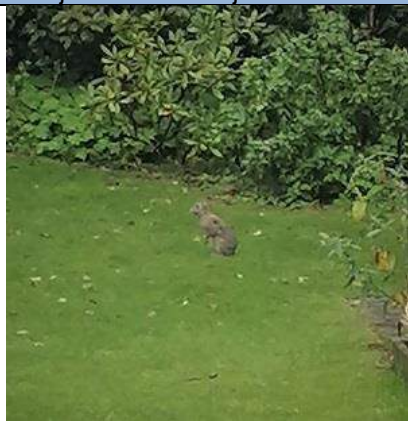
06/10, konijn , Veengarde, Nootdorp, Katja Schrijver.

Konijn of haas kan je melden. Fotografeer ze en stuur deze op naar natuurlijkdelfland@knnv.nl