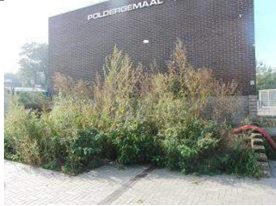
07/10, ganzenvoeten metershoog, station Delft Campus, Aukje Gjaltema.