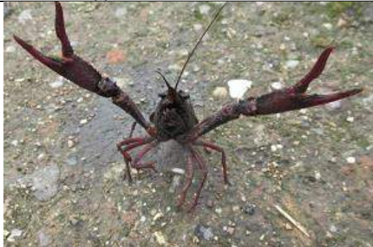
05/10, rode Amerikaanse rivierkreeft , Melariumpad Jos van Koppen.