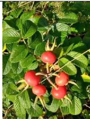
08/10, vruchten rimpelroos , Kijkduin, Lia Claus.