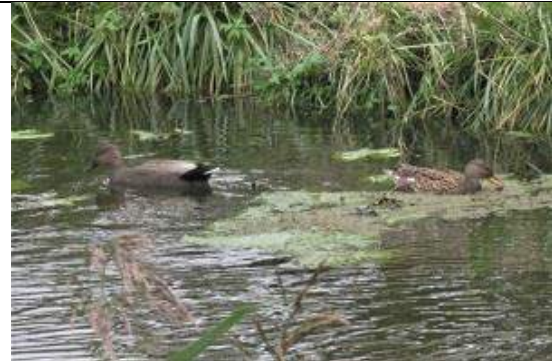
05/10, 37-16-33, krakeend mannetje en vrouwtje Delftsestraatweg Jos van Koppen.