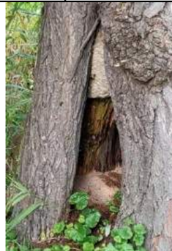
06/08 wespennest in knotwilg op boomgaard Slotgaard, imker Petra van der Burg.