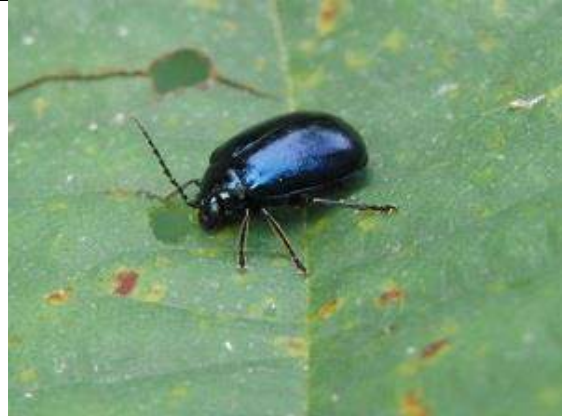
02/10, elzenhaantje , Overvoorde Rijswijk, Aukje Gjaltema.