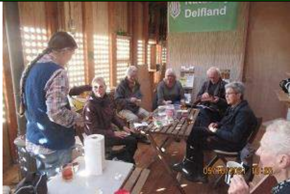
05/10, Melarium Natuurcafé Gallen .