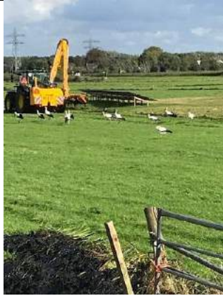
04/10, ooievaars , polder Abtswoude, Bruun vd Steuijt.