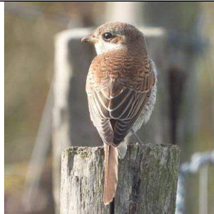
05/10, grauwe klauwier , De Banken, Frans van Antwerpen.