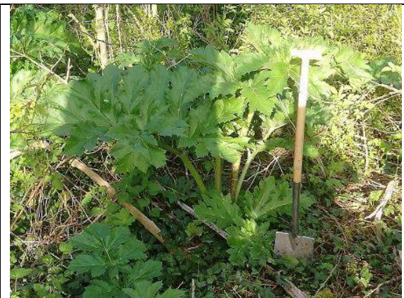
28/04, Pijnacker, meer dan een meter hoog.

Onze bijeenkomst van afgelopen woensdag was een succesvolle te noemen. Met z'n zessen hebben dat gebiedje geheel kunnen ontdoen van reuzenberenklauwen.