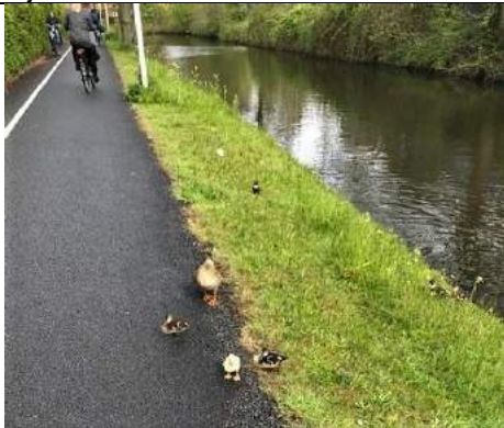
30/04, Componistenpad , Bruun vd Steuijt.