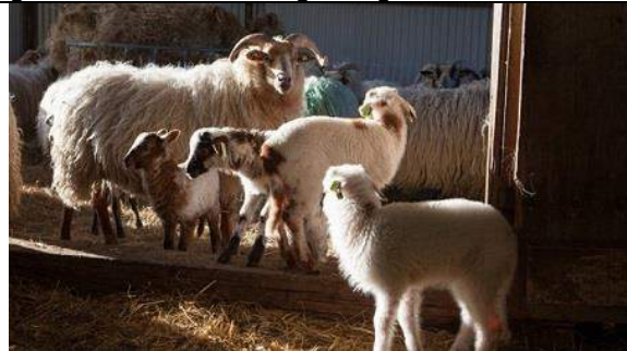
Schaapskudde Grazend populair

de schapen en geiten die bij Kijkduin onze natuurlijke duinen onderhouden zijn onderscheiden met de 'Pro Flora et Securitate' prijs, samen met duinboerderij de Willemshoeve (Westerhonk van 's-Herenloo). De grazers en hun hulpherders zijn super trots op de waardering die ze krijgen.