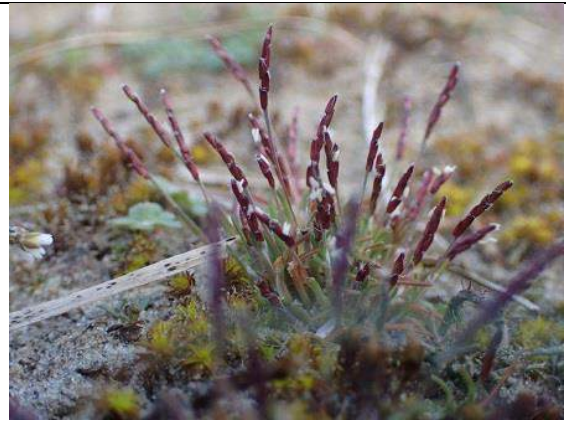
19/03, dwerggras , Karel Gort

Eén van de bijzonderste grassen die ik in Nederland heb gevonden is dwerggras . Ongeveer 3 tot 10 cm. hoog in dichte matjes. Voor een beter zicht op dit prachtige grasje moet je op je buik gaan liggen om hem optimaal te kunnen bewonderen. Vroeger inheems. Op waarneming.nl staat hij nu als ingeburgerd. Karel Gort