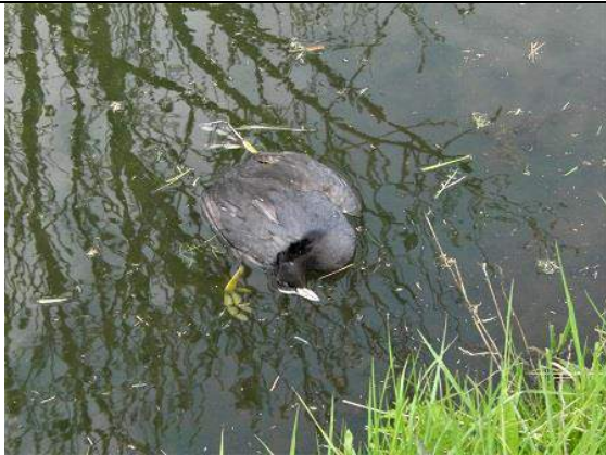
28/04, meerkoet 3 dood Abtswoude Aukje Gjaltema.