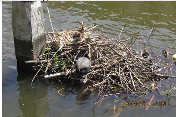
26/04, 37-16-21, meerkoet 7 jongen , Aan 't Verlaat, Jos van Koppen.