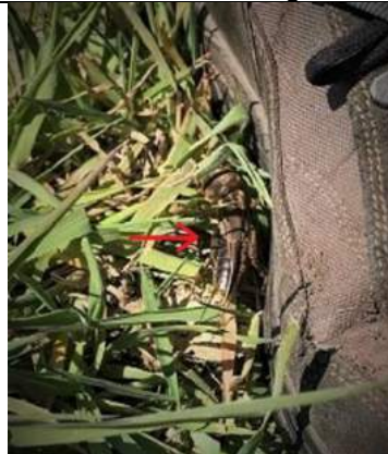
2/ 04, veenmol, de eerste van Siert (Kooi).