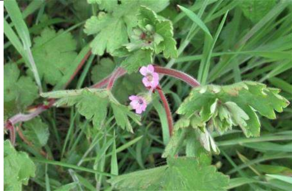
28/04, 37-16-31, ooievaarsbek Heempad, Jos van Koppen.

02/05, witte kogel , imago, Abtswoudse Bos midden, Geert en Marian; determinatie Niels Kimpel; op 11 april de eerste waarneming van Nederland door Anne Krediet en Dominic Dijkshoorn