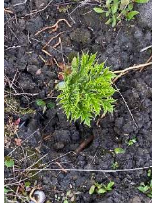
Twee weken geleden ook op deze plek gestoken, net niet ver genoeg zo te zien