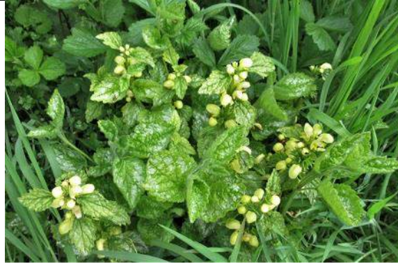
28/04, 37-16-31, gele dovenetel , Heempad, Jos van Koppen.