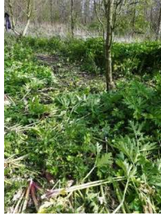
Voor de volgende keer