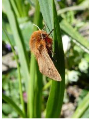
27/04, kleine beer , Den Hoorn, Willemein Poot.