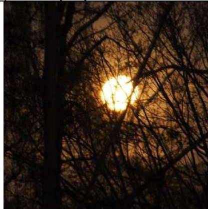
28/04, super maan , Gwenyth.