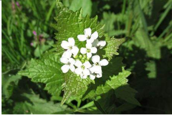
26/04, 37-16-21, look zonder look , Bieslandsepad, Jos van Koppen.