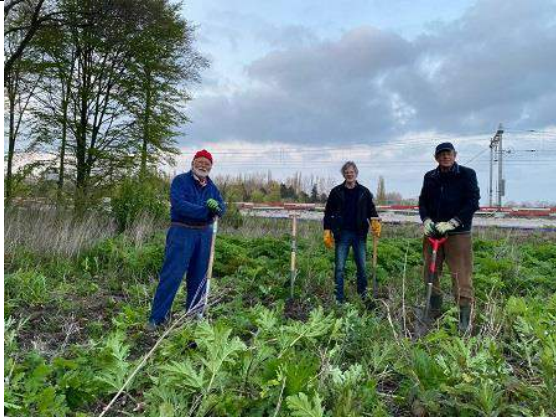
29/04, RBB Rijswijk Wilhelminapark.