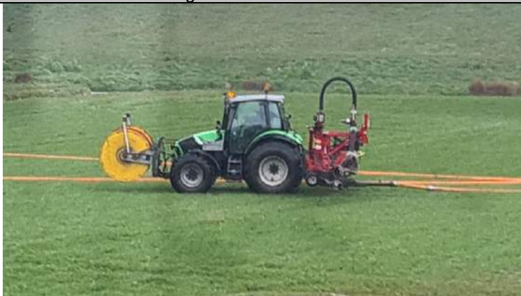
Illegale bemesting met drijfmest?

Tot de grote verbijstering van bewonersgroep Monster Noord en Natuurlijk Delfland bemestte een tractor duinvallei Watergat. Welke meststof gebruikt is, is bij de bewoners en Natuurlijk Delfland onbekend. Maar de penetrante stank van de mest of chemische stof, belooft niet veel goeds. Het is ongehoord dat naast natura 2000 gebied Solleveld, dat ook erg te lijden heeft onder de stikstofuitstoot duinvallei Watergat op dergelijke wijze wordt bemest. De meststoffen spoelen naar de ondergrond uit. Deze komen in het oppervlaktewater en in het grondwater. We hebben een melding gemaakt bij de omgevingsdienst. Voor de bemesting met drijfmest die ingespoten is, is een ontheffing van de Wet Natuurbescherming nodig. Zover wij, Natuurlijk Delfland en bewonersgroep Monster-Noord, weten ontbreekt die ontheffing.