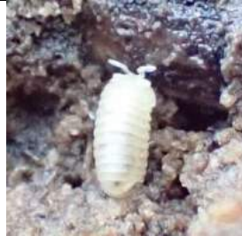
Witte kogel , 1 mm