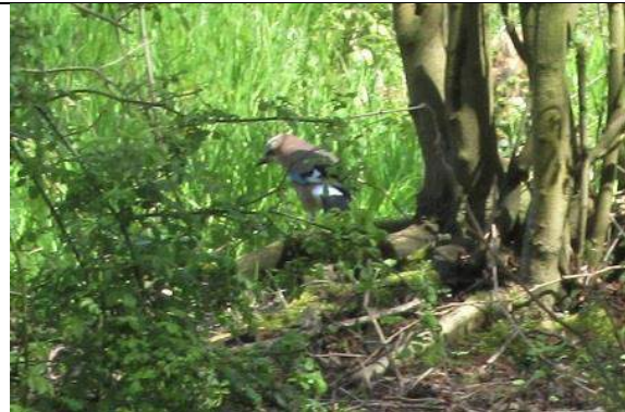
26/04, 37-16-21, gaai , Trimmerspad, Jos van Koppen.