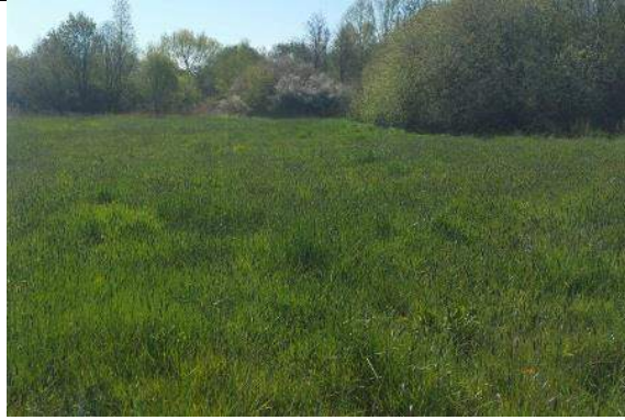
27/04, grote vossenstaart , bij Reijerspad Nootdorp, Berenice Wieman.