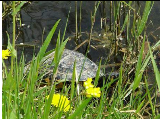
27/04, geelbuikschildpad bij nest , Abtswoudse park, Aukje Gjaltema.