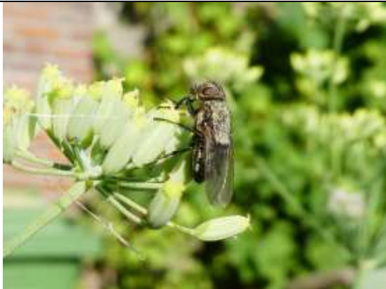
30/07, Pollenia , Den Hoorn, Willemein Poot.