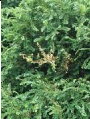
27/07, iepziekte , Abtswoudse bos, Aukje Gjaltema.