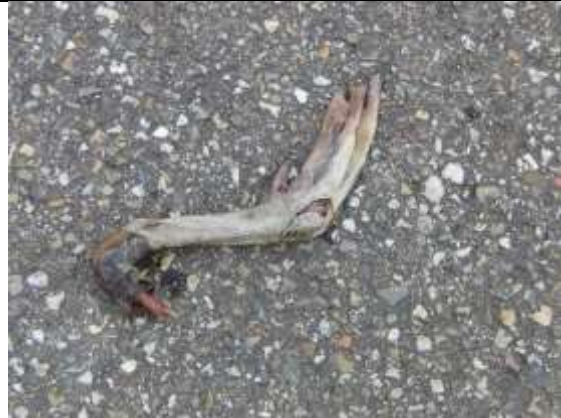
27 07, vogelpoot , Sint Maartensrechtpad, Aukje Gjaltema.