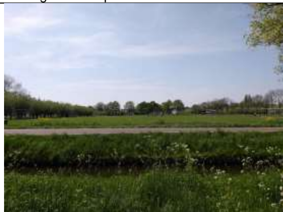
22/04, spelende kinderen in het Abtswoudsepark