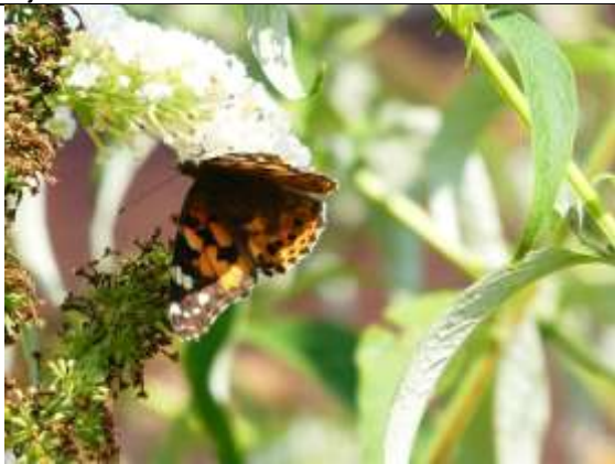
29/07, distelvlinder , Den Hoorn, Willemein Poot.