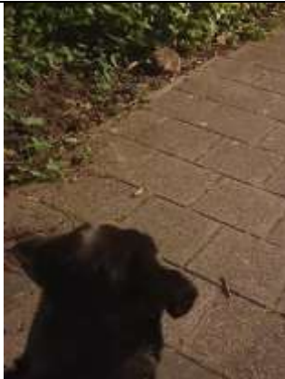
Egel en hond , Niekie