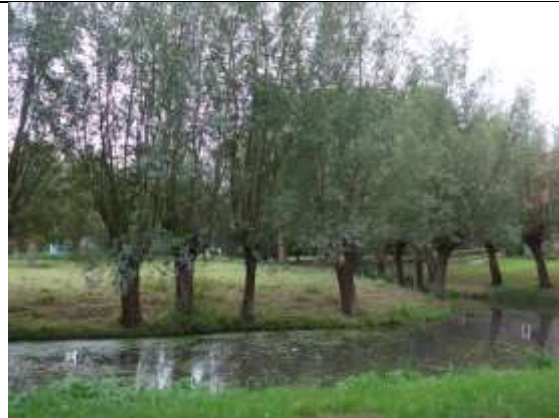
Boomgaard Chilipad 1

23/07, gesprek met bestuur Vereniging van Eigenaren (VVE) Chilipad 1 over natuurwaarden hoogstamboomgaard. Van het gesprek wordt een verslag gemaakt dat op de eerstvolgende VVE-ledenvergadering wordt besproken.