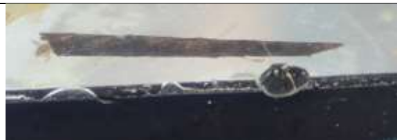
Kokerjuffer , zie het diertje dat links uit de koker steekt.