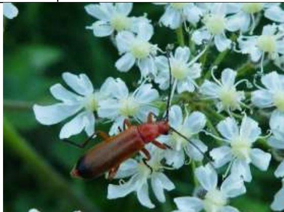
23/07, kleine rode wekschild op berenklaau , Willemein Poot.

22/07, snorzweefvlieg, ja het is me eindelijk gelukt om de snor te ontwaren bij de zweefvlieg . Er zijn veel meer wat kleinere zweefvliegen, maar deze snorren heb ik dus ook. Maasland, Thérèse Zwaard, Maasland.