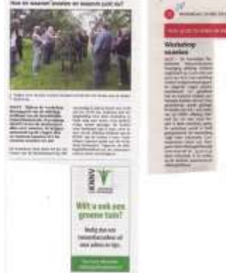
21/07, Delftse Post en Delft op Zondag, Workshops fruitbomen snoeien.