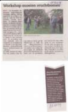
03/07, AD, Delftse Post P, workshop snoeien vruchtbomen.