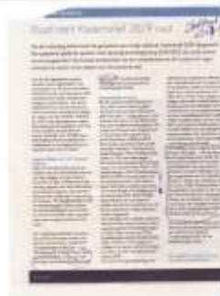
03/07, Stadskrant, Kaderbrief 2019 Groenfonds Openbaar Groen.