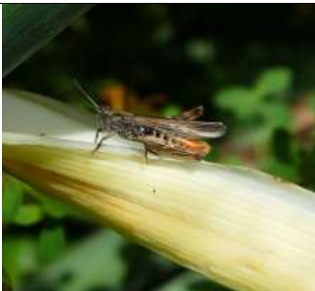
21/07, bruine sprinkhaan , Willemein Poot.