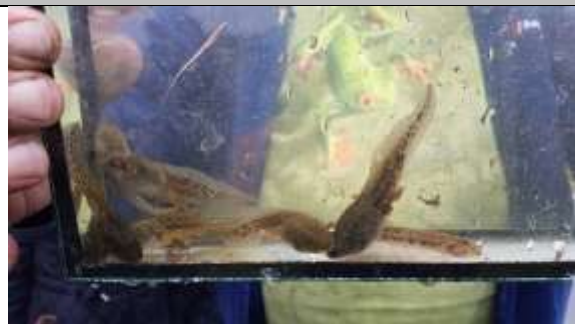
Groene kikkers (links), bittervoorn, rechts.