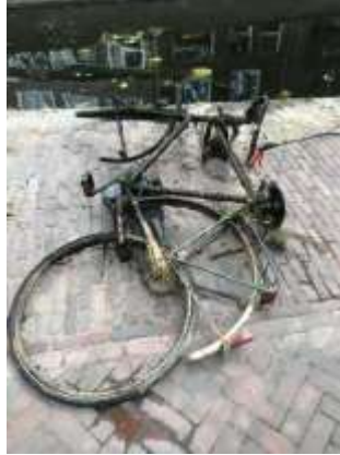
14/07, uit de gracht gevist, Bruun vd Steuijt