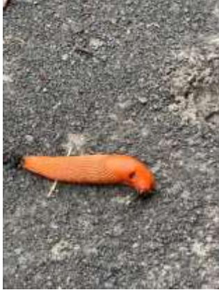
13/07, gewone wegslak , Anneke van Veen.

Als je geen account hebt mag je het melden via knndelft en zaterdag. Zet je naam in de toelichting.