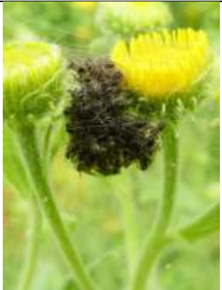
19/07, kraamwebspinnetjes , Den Hoorn, Willemein.