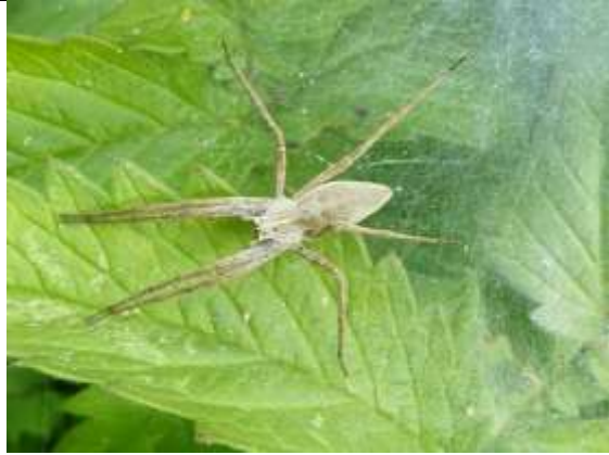
19/07, kraamwebspin , Willemein Poot.