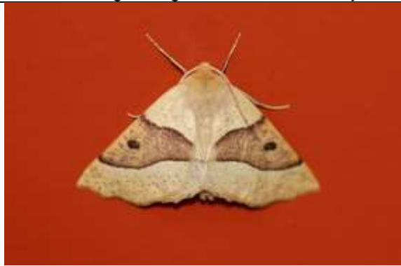
17/07, kortzuiger(crocallis elinguaris) , Delft, Jan van der Drift.