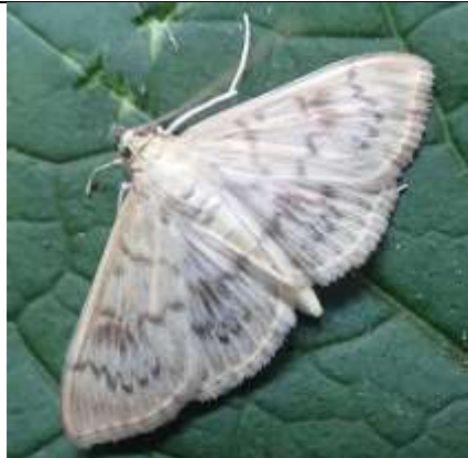
18/07, parelmoermot , Wezeltuon, Delft, Marian.