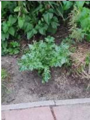
15/07, mariadistel , station Delft zuid, Peter Jacobs