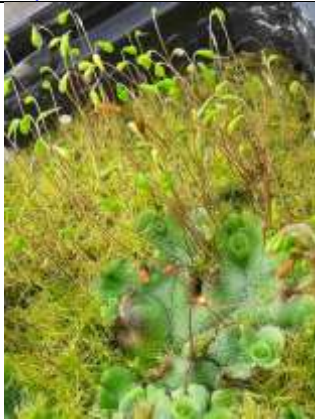
Slankmos (boven), parapluutjesmos (beneden)

https://www.knnv.nl/afdeling-den-haag/activiteit/bioblitz-soorten-zoeken-zonnegaarde-op-20-en-21-7-0